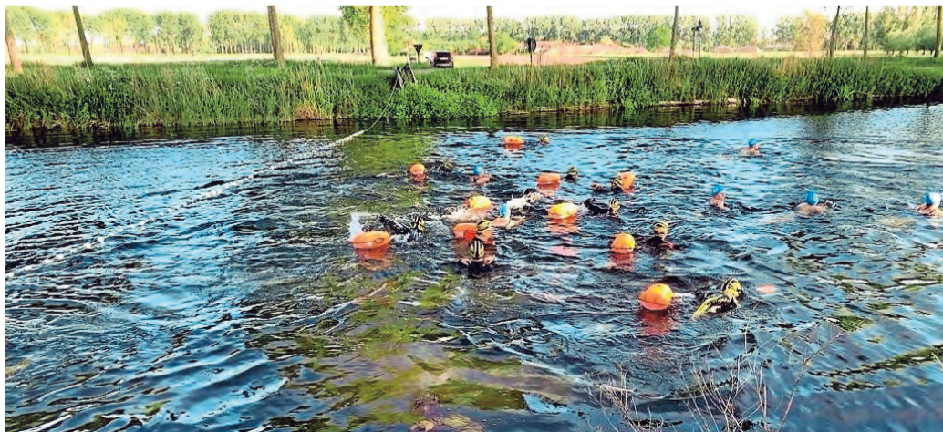
De Langerei Zwemmers en de Brugse IJsberekening baden in de Damse Vaart.

'Openwaterzwemmers' trekken eerste baantjes van het seizoen