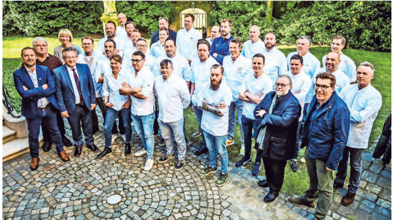
Deze chef-koks geven op zaterdag 28, zondag 29 en maandag 30 september het beste van zichzelf, voor het laatst onder de balkonrotonde.

Nog één keer vindt het gastronomische evenement KooKeet eind september plaats in de beproefde formule onder de balkonrotonde. De tiende editie in 2020 vertoeft op 't Zand én zal er anders uitzien. «Op vraag van de chefs, want KooKeet vraagt een enorme inspanning», zegt burgemeester Dirk De fauw. «Maar de naam blijft behouden.»